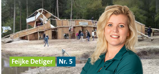
Feijke Detiger Nr. 5

“Een klim- en speelbos missen we nog in Wijchen.”