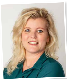
Feijke Detiger Nr. 5

“Investeer in onze jongeren. Zij zijn de toekomst.”